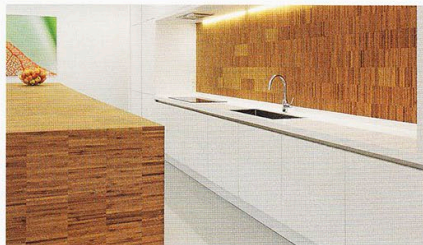
Ob Gestaltung von Türen, Wänden oder Trennwänden – die Verarbeitungsmöglichkeiten des Bambuswerkstoffes sind vielfältig.

Bambus wird auf Grund seiner Eigenschaften häufig als „das“ Holz des 21. Jahrhunderts bezeichnet: Es ist die schnellst wachsend Pflanze der Welt, bei der Ernte wird sie nicht vernichtet, sondern wächst wieder nach. Hersteller Moso bietet für die Verkleidung von Wänden hochwertige Furniere, Platten und Rollenware aus diesem traditionellen Baustoff an. Die Verarbeitungsmöglichkeiten der Werkstoffe für die Gestaltung von Türen, Schiebetüren, Wänden oder Trennwänden sind ebenso vielfältig wie ihre Optik und ihr Aufbau. Meist wird für die Verkleidung Bambus-Rollenware mit einer