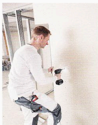
Massive, aber trotzdem schlanke Wände – ein Wunsch vieler Planer, Handwerker und Bauherren.

Wohnungen sind immer auch ein Rückzugsort für ihre Bewohner und sollen Raum zur Erholung und Entspannung bieten. Dafür müssen sie weitestgehend frei von äußeren Lärmeinflüssen sein, die Wohlbefinden und Konzentration stören. Deshalb ist eine sorgfältige Planung des Schallschutzes im Wohnbau zu einer der wichtigsten Anforderungen geworden. Hier leistet der Hersteller Rigips Habito einen Beitrag zu mehr Komfort: Dank ihres massiven Charakters wirkt die Wohnbauplatte Rigips Habito schalldämmend und bietet eine deutlich bessere Schallreduktion im Vergleich zu herkömmlichen Mauerwerkswänden. Ebenso „systemimmanent“ wie ein guter Schallschutz ist der positive Einfluss der Wohnbauplatte auf das Raumklima. Diese ist